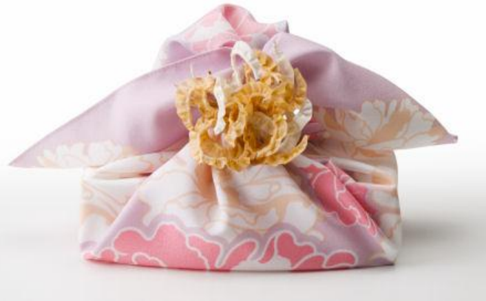
Motaiの“もったいない”風呂敷