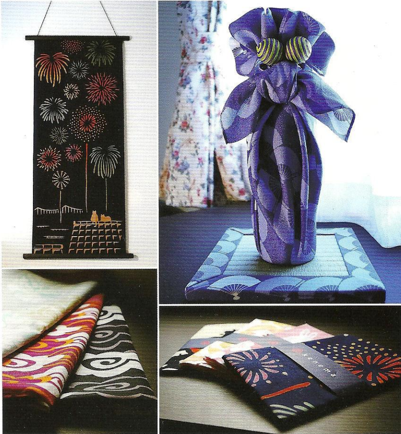
右上) 箱や包装紙が無くても、風呂敷があればこんなにお洒落に 左上) タバストリー感覚で、手ぬぐいのコレクションを楽しむ

きれいな風呂敷で、贈り物のお酒をラッピング。 季節ごとに柄を楽しむ、手ぬぐいの掛け軸コレクション。 暮らしを楽しく彩る、和洋融合のアイデア——。